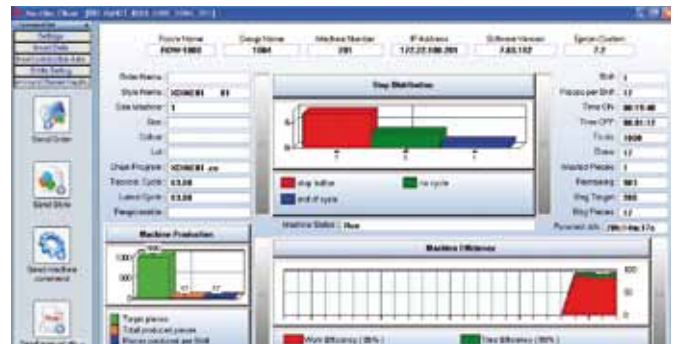
Stato delle macchine. Machine condition monitoring.