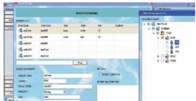
Stato delle macchine. Machine condition monitoring.

NAUTILUS LIGHT is a system for the control of the production and it is dedicated to small-medium size production of hosiery and knitting business. It is a specific IT system for centralized management of production, suitable to optimize processes and allow the improvement of production efficiency. This IT system is a direct replacement of the data collected so far by hand made by employees, by spread sheets with their processing and by first-generation software able to process small amounts of data. By using NAUTILUS LIGHT you can get benefits on the production since you will have the full traceability of production and quality control and, thanks to the data thus collected, we will be able to provide timely information on trends and corrections to be made to optimize processes, sa-