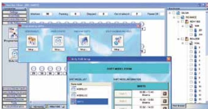
Controllo remoto della macchina e stato della sala macchina. Machine remote control and machines room condition monitoring.